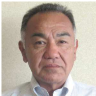
㊦ 一本松 桃里・植田 望月 芳彦 ● (有)望月塗装工業