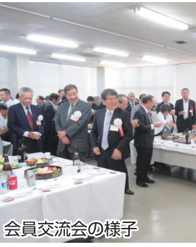
会員交流会の様子