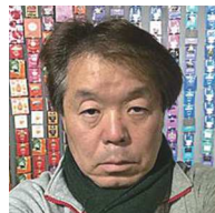
㊦ 愛鷹、東部 伊藤 昌之 ● 愛昌園茶舗