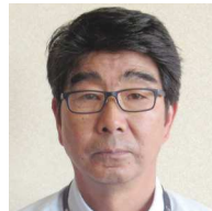
㊦ 東町、西町 成島 修 ● (株)進興