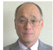
㊦ 浮島 伊山 修 ● 伊山サイクル整備工場