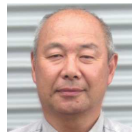
㊦ 浮島 成島 安司 ● (株)ナルシマ